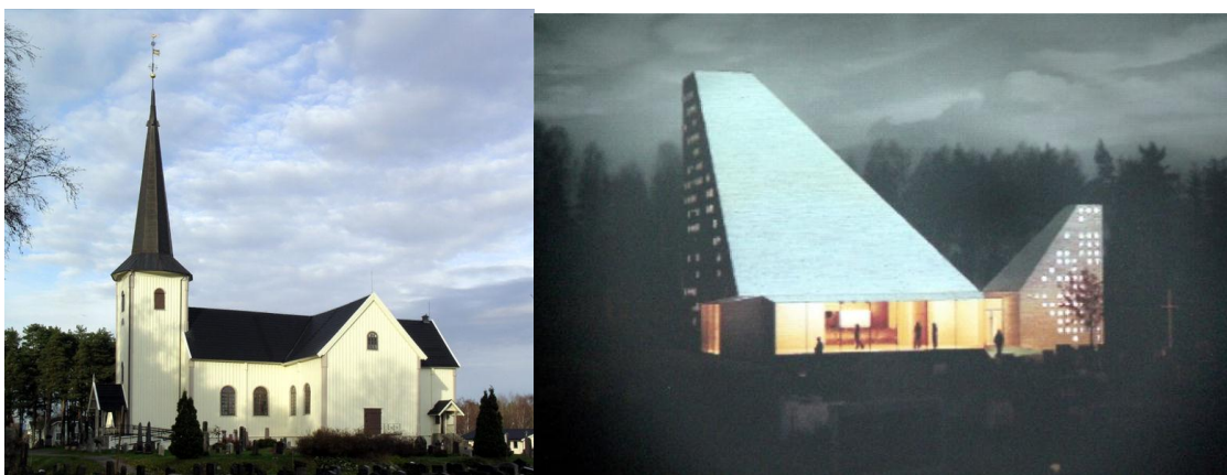
Stridens kjerne: Våler kirke før brannen (til venstre) og vinnertegningen til ny Våler kirke (til høyre)

Våler-politikere ber om folkeavstemning i kirkestriden Men fellesrådslederen skjønner ikke poenget. http://www.vl.no/troogkirke/valer-politikere-ber-om-folkeavstemning-i-kirkestriden/